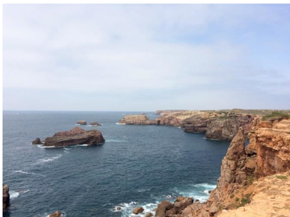
Pontal de Carrapateira, Costa Vicentina