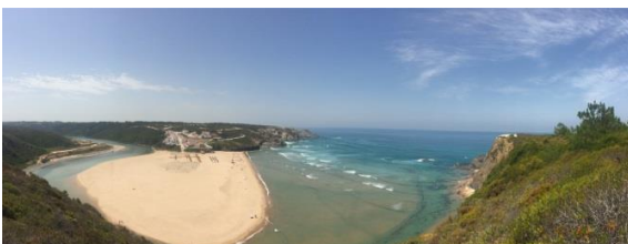
Praia de Odeceixe, Costa Vicentina