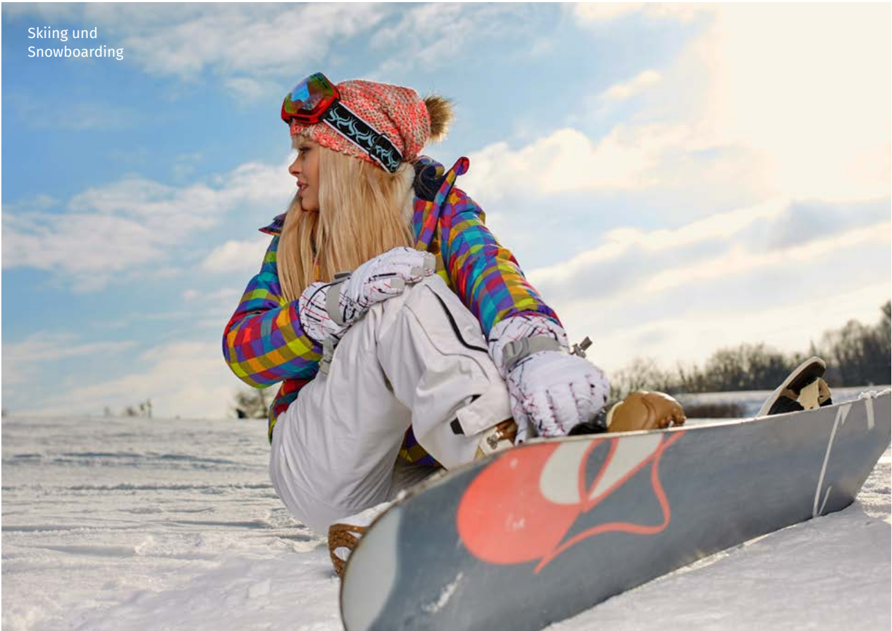
Skiing und Snowboarding